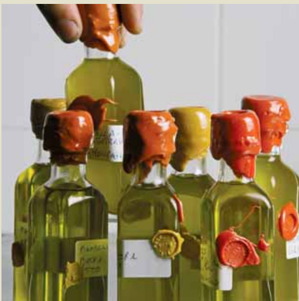
Toscana Igt, Dop Lucca, Dop Chianti Classico e Dop Terre di Siena sono i quattro oli toscani degustati al Vinitaly 2007

L'olio si presenta normalmente di colore verde più o meno intenso nell'olio appena ottenuto che, con il passare del tempo, tende a virare verso il giallo, mantenendo comunque riflessi verdi. All'olfatto ricorda profumi vegetali verdi con sensazioni finali rotonde, al gusto è sempre presente una nota amara più o meno evidente e sensazione di piccante. Le sensazioni