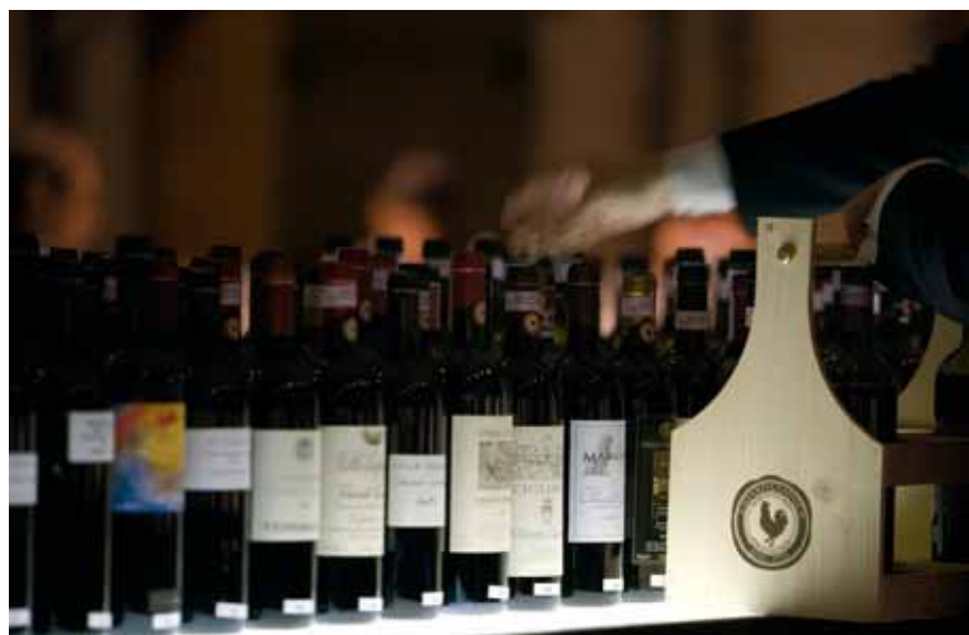
Un successo internazionale quello raggiunto dal Chianti Classico. Il suo profumo e la sua fragranza lo rendono uno dei vini più amati al mondo

Il mercato internazionale conferma il Chianti Classico come il vino italiano più amato negli Usa. La denominazione toscana risulta, infatti, per la prima volta il vino più venduto negli Stati Uniti che nel nostro Paese, con una vendita pari al 30% rispetto al 27% in Italia. Su 50 milioni di bottiglie si è registrato un giro d'affari di 535 milioni di euro. La congiuntura corrente della produzione e del mercato del vino prodotto fra Siena e Firenze è decisamente positiva. Dopo una fase di stasi, il mercato ha mostrando chiari e confortanti segni di espansione, con un aumento delle vendite (+14% del 2005 sul 2004 e +5% del 2006 sul 2005). L'ultimo semestre del 2006