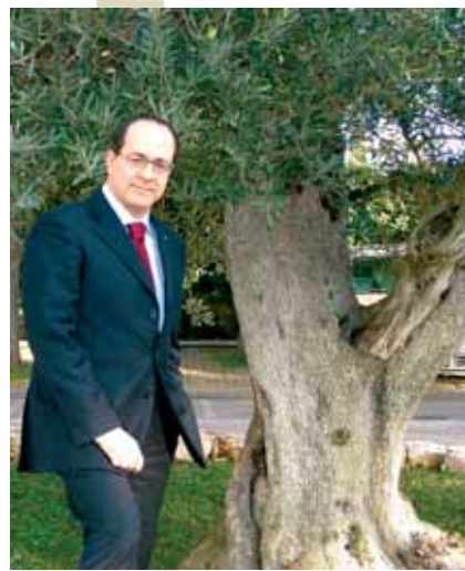
Paolo De Castro, ministro delle Politiche Agricole, Alimentari e Forestali

All'inaugurazione del Vinitaly, sul Treno del Vino saranno presenti il ministro per le Politiche Agricole e Forestali, Paolo De