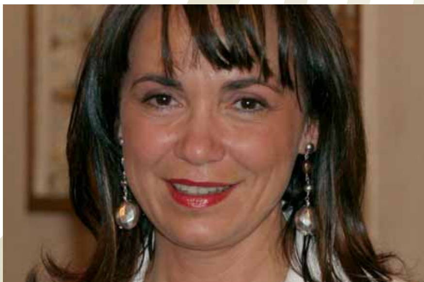
Susanna Cenni, assessore all'Agricoltura e Foreste della Regione Toscana dal 2005

«Credo che in un mercato così competitivo nulla possa nascere dal caso: il successo del vino toscano si deve a una costante, vorrei dire quotidiana riconferma di una strategia di qualità da parte dei nostri produttori e anche dalla loro costante capacità di rilanciare su se stessi: questo permette loro di produrre perseguendo strade di ricerca per migliorare i loro vini, nel pieno rispetto delle loro radici e della loro tipicità. Questo lavoro, che dà i suoi risultati sul mercato, è poi costantemente monitorato dagli esperti. E i risultati sono evidenti: nel 2006 i vini toscani hanno