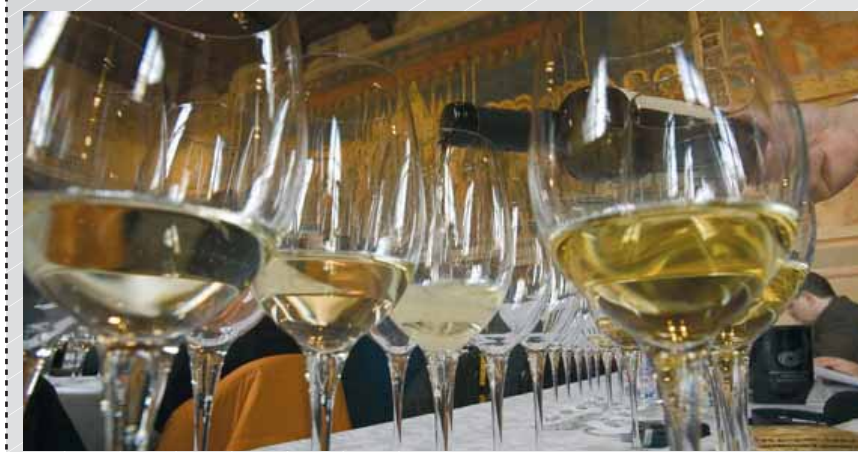
La pittura, i grandi vini e le bellezze dei luoghi di Siena si fondono in un'unica esperienza trascinandoci tutti e cinque i sensi

I prodotti d'eccellenza, la grande pittura, le bellezze paesaggistiche del territorio senese si fondono in un'unica esperienza che coinvolge tutti e cinque i sensi. Succede con le Degustazioni ad Arte, l'inedita proposta che Terre di Siena presenta al Vinitaly di Verona. Il 31 marzo alle 14.30, nello stand della Regione Toscana, il percorso proposto sarà quello del Laboratorio Sensoriale Dolcezza d'ambra a Siena , con gli abbinamenti tra Vernaccia di San Gimignano e Pala di San Cirino di Sano di Pietro, Chianti Classico e Madonna della Misericordia di Simone Martini, Vin Santo di Chianti e Piccola Maestà di Ambrogio Lorenzetti. A fare da sottofondo, musiche di Bizet e Beethoven e brani di Mario Luzi, Nico Orengo ed Henry James, il tutto