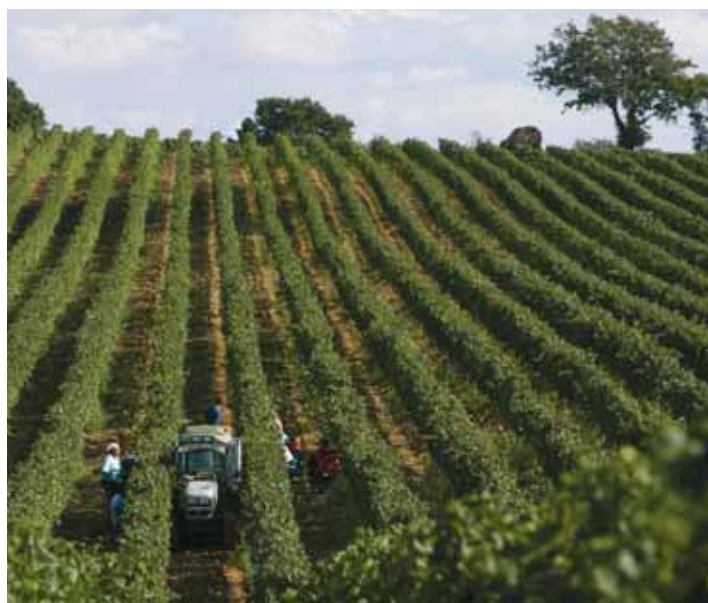
Un volume che raccoglie l'eccellenza dell'enologia toscana insieme al suo territorio e alla sua storia

Il lavoro, la passione e tutto ciò che riguarda il vino dal paesaggio alla bottiglia. Una per una, sono state prese in esame e approfondite tutte le Doc e le Docg toscane. Inoltre, i disciplinari, le strade sul vino, centinaia di foto a colori ad arricchire come preziosi dettagli i testi del volume, già pezzi importanti nella ricostruzione storica dei vitigni e nell'approfondimento delle caratteristiche dei vini. Un volume ricco e prezioso, dunque, che porta la presentazione dell'assessore regionale all'Agricoltura Susanna Cenni, che apre con parole ricche di entusiasmo e consapevolezza che in un bicchiere di vino toscano è racchiuso molto di più, a cominciare dall'affatica