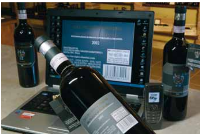
Bottiglia con il codice di sicurezza “CertiLogo”. Con una semplice telefonata o via sms o via web si comunica il codice e, in tempo reale, si riceve la conferma dell'autenticità del vino

La bottiglia vi parla dallo scaffale: da oggi sarà un sms a dirvi se il vostro Brunello di Montalcino è originale oppure solo il prodotto di un falsario del vino. Dopo l'ologramma - sistema che protegge dalla falsificazione banconote, passaporti e carte di credito - il Brunello di Montalcino va oltre e adotta l'ultima frontiera della communication technology: da ogni angolo del mondo, in tempo reale, con un semplice sms, chi acquista una bottiglia di uno dei simboli del “Made in Italy”